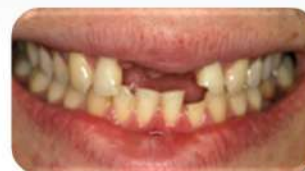
Острая травма – перелом центральных резцов