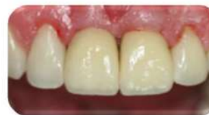
Зафиксированы временные коронки