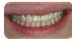
Через 3 месяца временные коронки меняются на постоянные