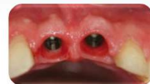
Удалены остатки корней, установлены имплантаты Эниридж